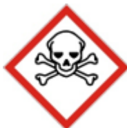
GHS06 Akute Toxizität